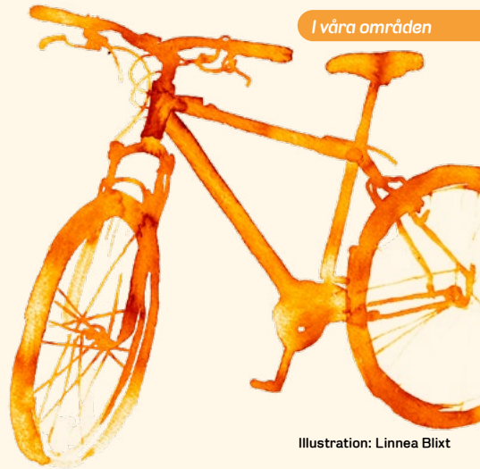
Illustration: Linnea Blixt

Cykelfrämjandet, som lånar lokal av oss i Hässelby, ordnar både cykelkurser och cykelutflykter och Svenska med Baby bjuder in till gratis familjeträffar.