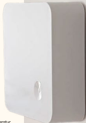
Låt dosan sitta uppe. Den är helt ofarlig och registrerar bara temperatur.